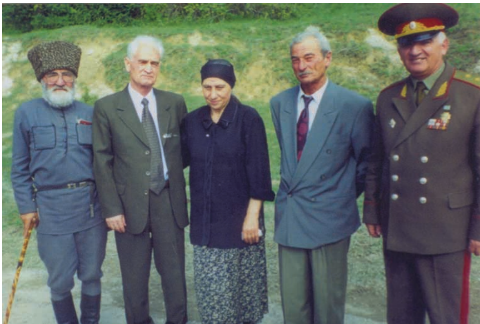
Аибашыра ахым җапысуаз атытқда ратҗара