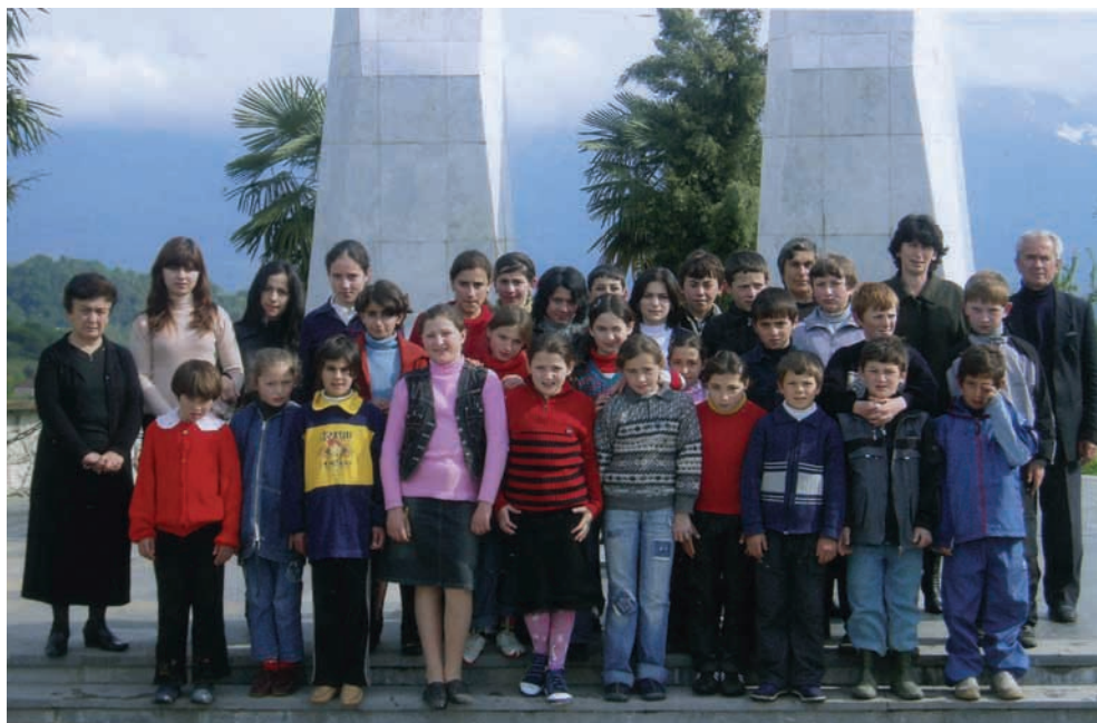
Сергеи Дбар ицъабаа зду ит̄ахаз Мг̄эызырхэаа рба̄ка аґаг̄хьа