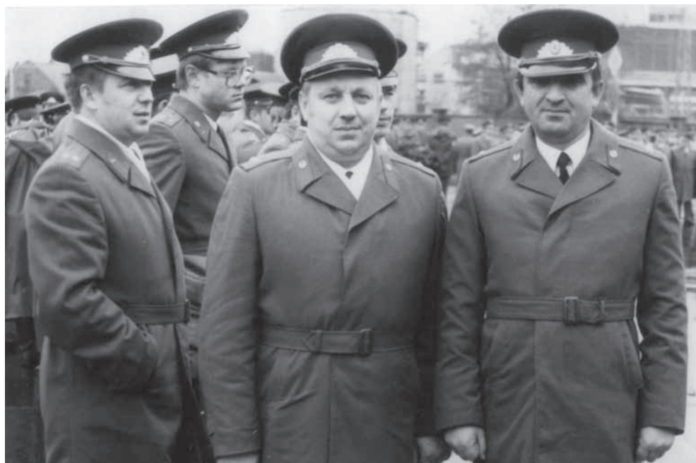
Германия. Сергей Дбар аррамайура данахысуаз