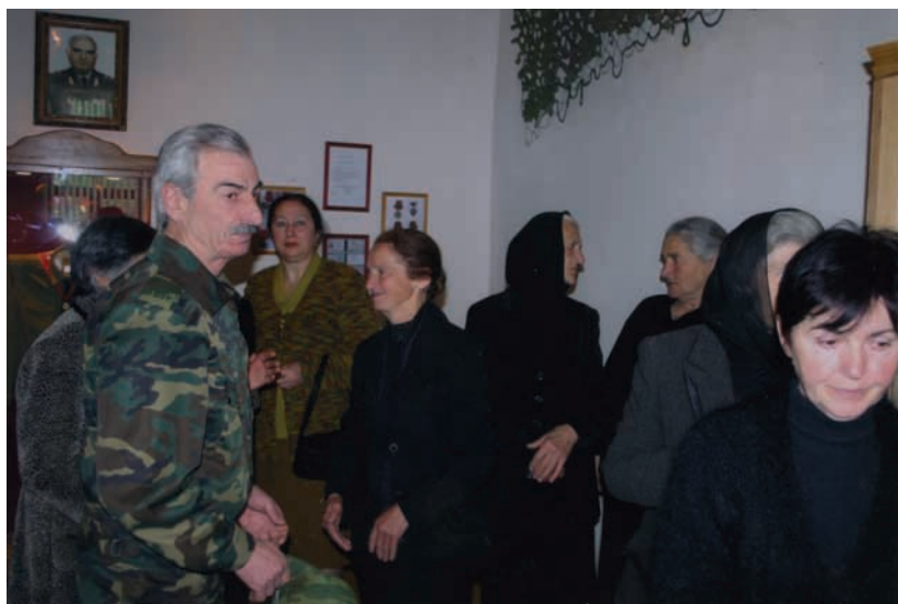
Г̄эдоут̄ат̄эи ам̄узеи Сергеи Дбар их̄вз анах̄ыр̄ц̄оз