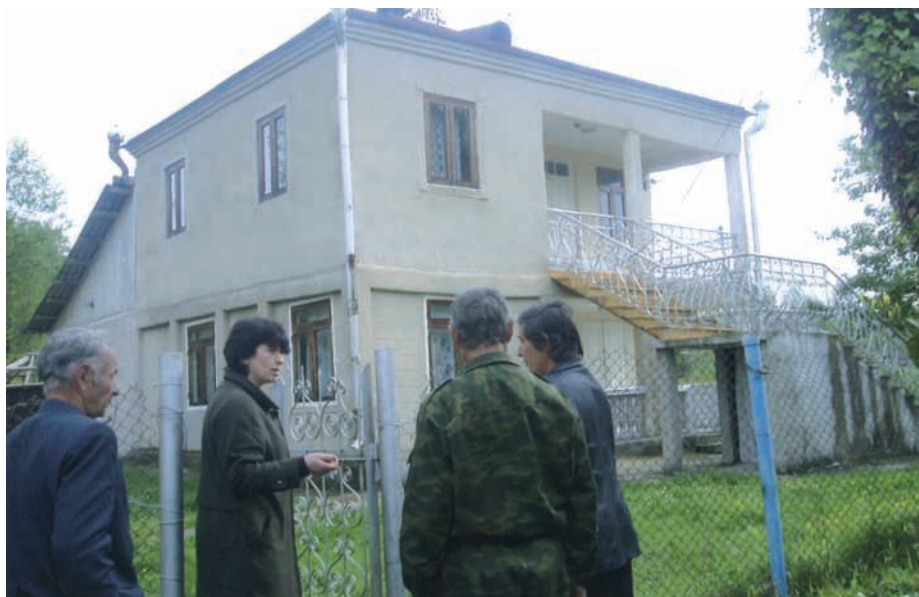
Сергей Дбар игэарата, ифны