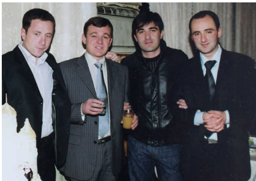
Зеггы рзы згэы былуз, Денис...