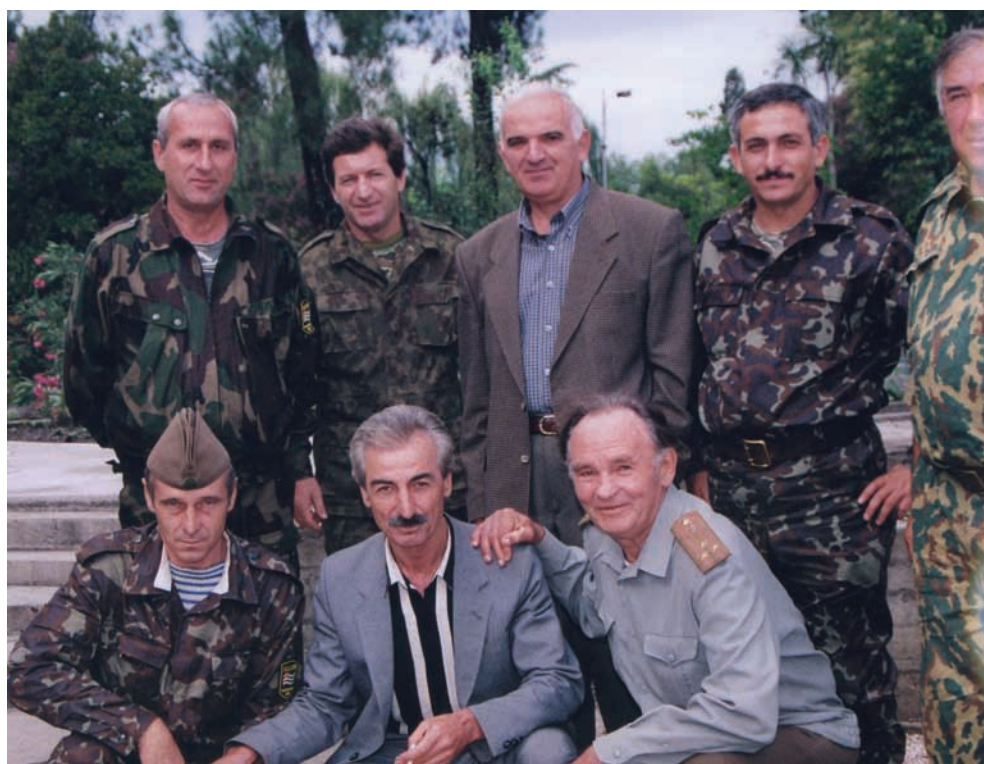
Сергеи Дбар гәытәык ифызцәеи иареи